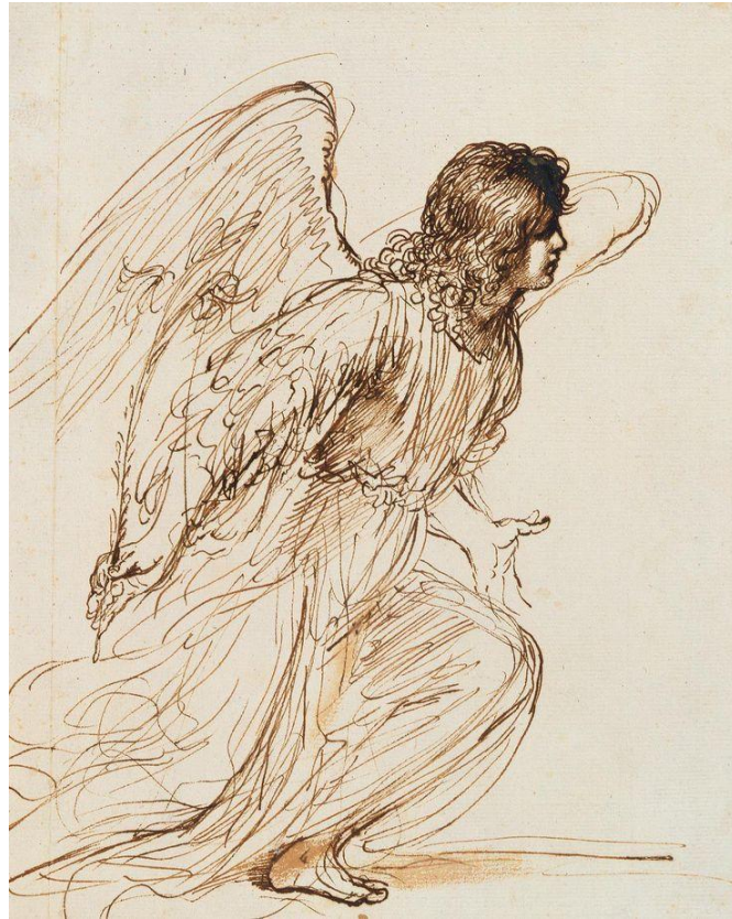
modlitwa do Anioła Stróża

Prosimy Cię, Duchu Niebieski, Święty Strózu i obrońco nasz, abyśmy drogą spokojną, szczęśliwą i zbawienną przez Ciebie, Wodza naszego, byli prowadzeni, i od wszelkiego ducha złego i ciężkiej pokusy obronieni: spraw to, abyśmy za Twoją pomocą według woli Bożej strzegli się wszelkich występków, a ćwiczyli w cnotach chrześcijańskich, póki się nie stawimy przed Panem w szczęściu wiekuistym. Amen.