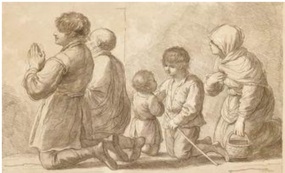
modlitwa za rodzinę

Najświętsza Rodzino, z wielką ufnością przychodzimy do Ciebie, aby prosić Cię o pomoc. Sami słabi jesteśmy i biedni. Nie liczymy też na nasze dobre uczynki i zasługi, ale wyłącznie na Twoją łaskawość i dobroć. Wierzimy, że ze szczególną miłością spojrzysz na nasze rodziny i otoczysz je przemożną opieką. Niech każda rodzina katolicka, odnowiona według wzoru Rodziny Nazaretańskiej, stanie się świątynią Bożą, w której każdy znajdzie pokój w udrękach, schronienie w zawodach, podporę w upadkach i nadzieję w zwątpieniach. Przez Chrystusa Pana naszego. Amen.