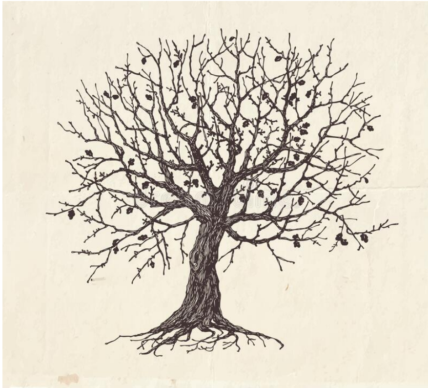
modlitwa o nawrócenie grzeszników

Wieczny Boże, Stwórco wszystkich rzeczy, wspomnij, że Ty sam dusze tych grzeszników na obraz i podobieństwo Twoje stworzyłeś. A oto, Panie, niemi się piekło napęlnia! Pamiętaj, że najmilszy Syn Twój Jezus dla ich zbawienia najokropniejszą śmierć poniósł. Nie dozwól więc, błagam Cię, o Panie, aby one w swych grzechach pozostały, a Synem Twoim pogardziły, lecz modlitwami Świętych Twoich, i świętego Kościoła przebłagany, wspomnij na miłosierdzie Twoje! Zapomnij nieposłuszeństwa i występki ich, a spraw, aby i one z całego serca nawróciły się do Tego, któregoś posłał, Pana naszego, Jezusa Chrystusa, przez którego odkupieni jesteśmy i któremu niech będzie chwała na wieki wieków.