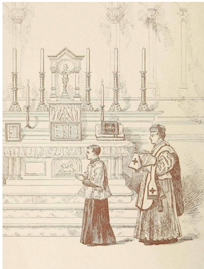
modlitwa za kapłanów

O Jezu, Wieczny i Najwyższy Kapłanie, miej swoich kapłanów w opiece Twego Najświętszego Serca, gdzie nikt im nie może zaszkodzić. Zachowaj nieskalane ich namaszczone dłonie, które codziennie dotykają Twojego świętego Ciała. Zachowaj w czystości ich wargi, które są czerwone od Twojej Najdroższej Krwi. Zachowaj w czystości i wolności od spraw ziemskich ich serca, naznaczone wzniosłym piętnem Twojego pełnego chwały kapłaństwa. Pozwól im wzrastać w miłości i wierności Tobie i strzeż ich przed skażeniem świata. Daj im siłę przemiany chleba i wina, daj im także siłę przemiany serc. Pobłogosław ich pracą bogactwem owoców i obdarz ich następnie koroną wiecznego żywota. Amen.